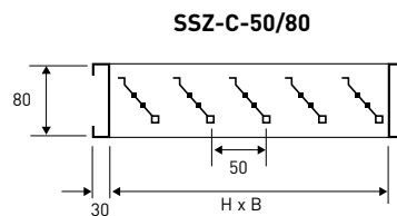
TABELLA DI SELEZIONE / SELECTION TABLE